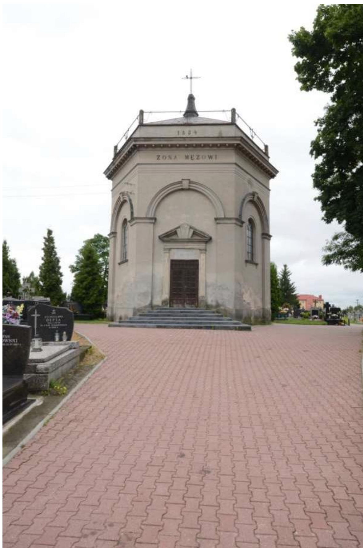
Widok ogólny od frontu